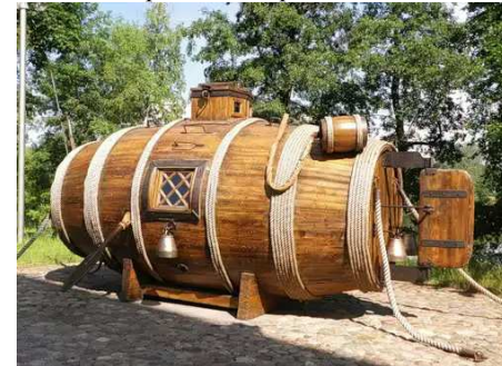
Первая русская подводная лодка

решались надводными кораблями, и они были главным родом сил флота. В период Второй мировой войны эта роль на некоторое время перешла к морской авиации, а в послевоенный период с появлением ракетно-ядерного оружия и кораблей с атомными энергетическими установками в качестве главного рода сил утвердились подводные лодки. Окончательно Военно-Морской Флот как разнородное стратегическое объединение сформировался к середине 1930-х годов, когда в состав ВМФ вошли морская авиация, береговая оборона и части ПВО.