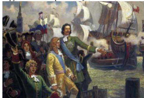
Б. Ольшанский. Рождение Российского флота

В октябре 1696 года решение Боярской думы законодательно определило создание Российского флота и положило начало его строительству. "Морским судам быть..." - такова была воля не только молодого русского царя Петра I, но и его сподвижников, хорошо понимавших, что без флота государство не может сделать нового шага в своем развитии. На многочисленных верфях, разбросанных по всей территории России, строились корабли Российского флота самых разных классов. К весне 1700 г. на воду было спущено 40 парусных и 113 гребных судов.