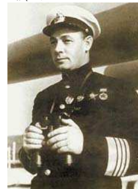
в 1939 году на должность народного комиссара Военно-морского флота СССР был назначен Н.Г. Кузнецов

Современная система органов управления ВМФ окончательно сложилась накануне Великой Отечественной войны. 15 января 1938 года Постановлением ЦИК и СНК был создан Народный комиссариат ВМФ, в составе которого был образован Главный морской штаб. В годы Великой Отечественной войны Военно-Морской Флот надежно прикрывал стратегические фланги советско-германского фронта, наносил удары по кораблям и судам противника, защищал российские морские коммуникации.