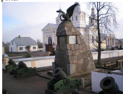
Памятник в честь победы русских войск в Кобрине

Это была первая крупная победа русских над наполеоновскими войсками со времени их вторжения в Россию. Бой под Кобрином характерен точностью и согласованностью действий отдельных отрядов и главных сил 3-й Западной армии, быстрым и своевременным манёвром войск, решительностью их действий, умелой дезинформацией противника. Вместе с тем, отказ Тормасова от преследования главных сил саксонцев, позволил им избежать полного разгрома.