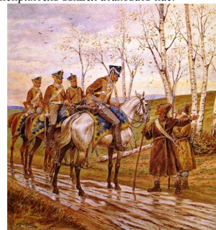
Война 1812 г...

Чаплиц получил повеление главнокомандующего отступить от Сигневич в Антополь, и в то же время неприятель вышел атаковать нас.