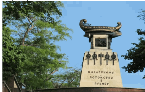
Первый памятник, воздвигнутый в Севастополе

Заложенный в 1834 году к пятилетию боя, был открыт в 1839 году памятник подвигу Казарскому. Инициатором создания памятника стал командующий Черноморской эскадрой адмирал Михаил Петрович Лазарев. Памятник создан по проекту Александра Павловича Брюллова. Установлен в начале Морского бульвара Севастополя на деньги, собранные моряками Черноморского и Балтийского флотов. Памятник представляет собой древнегреческую триему, стоящую на кубе, который установлен на постаменте в виде усеченной пирамиды. На постаменте написана лаконичная надпись «Казарскому. Потомству в пример».