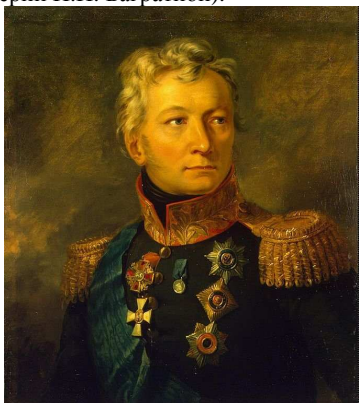
Генерал от кавалерии А.П.Тормасов

Наступавший в направлении Белосток, Слоним саксонский корпус генерал Ж. Ренье занял Брест, Кобрин, Пинск и главными силами находился в Пружанах. 5 (17) июля командующий 3-й Западной армией генерал от кавалерии А.П. Тормасов получил приказ атаковать во фланг и в тыл противника, действовавшего против 2-й Западной армии (генерал от инфантерии П.И. Багратион).