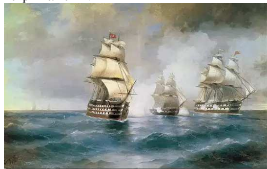
Меркурий атакованный двумя турецкими кораблями

Одна из известнейших картин Айвазовского - "Бой брига "Меркурий" с турецкими судами". Этот бой произошел 14 мая 1829 года. 18-ти пушечный бриг "Меркурий", курсируя у берегов Босфора, неожиданно встретился с двумя линейными турецкими кораблями. На предложение неприятеля сдаться, командир брига капитан-лейтенант А.И. Казарский решил вступить в бой и, в случае необходимости, взорваться с одним из неприятельских кораблей. Русский корабль имел 18 орудий против 184 неприятельских.